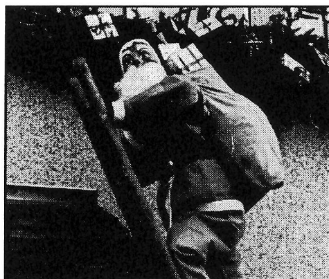
Eh oui ! Le Père Noël existe bien. Nous l'avons surpris à Altviller.

Vous êtes toutes et tous cordialement invités à la cérémonie de Présentation des Voeux du Maire le vendredi 9 janvier 1998, à 20 heures au Foyer.