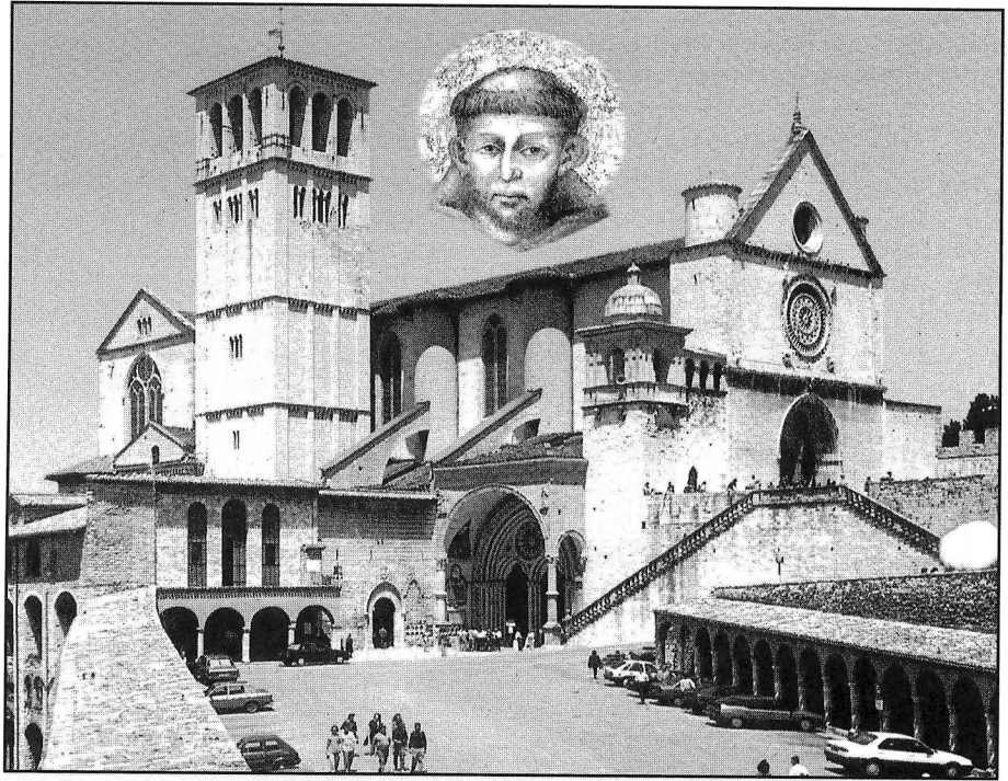
Basilique Saint-François à Assise

Assise est une ville au coeur de l'Ombrie, à mi-côte du mont Subasio à une altitude de 1 290 mètres. Saint François naquit pendant le froid de l'hiver 1 182 d'une famille aisée d'Assise. La jeunesse de François s'écoula entre ses